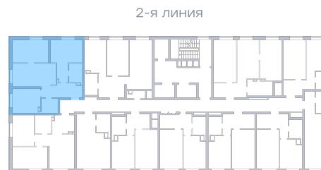
Лесопарк 60-летия Советской вла...