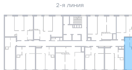
Лесопарк 60-летия Советской вла...