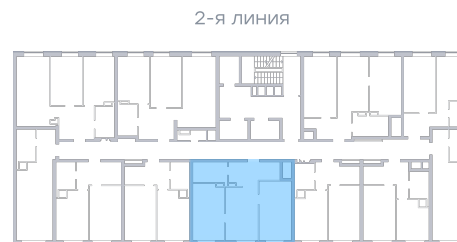
Лесопарк 60-летия Советской вла...