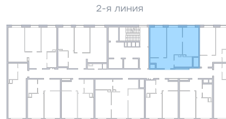
Лесопарк 60-летия Советской вла...