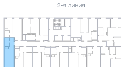
Лесопарк 60-летия Советской вла...