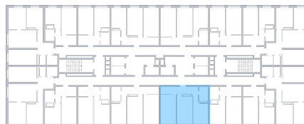
Лесопарк 60-летия Советской влас...