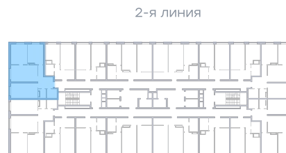
Лесопарк 60-летия Советской вла...