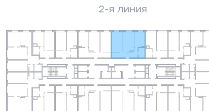
Лесопарк 60-летия Советской вла...