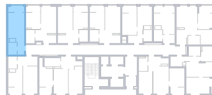
Вид во двор На плане