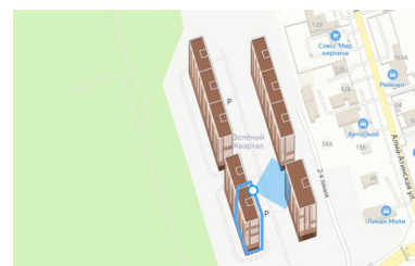
Вид из окна