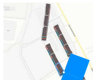
Вид из окна