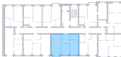
Вид во двор На плане