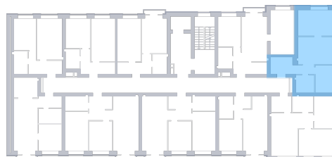
Вид во двор На плане