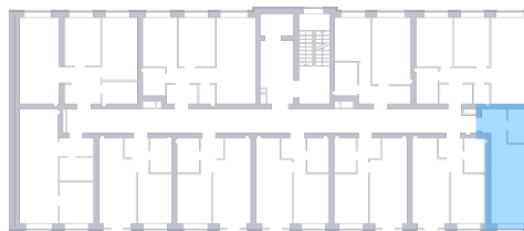
Вид во двор На плане