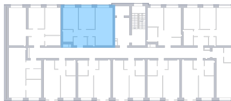
Вид во двор На плане