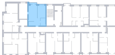
Вид во двор На плане