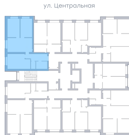
Вид во двор На плане