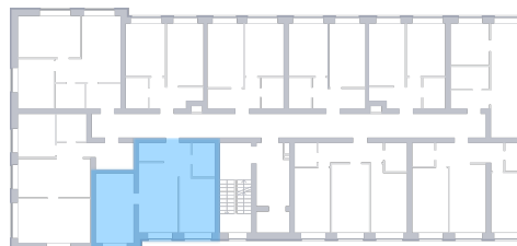
Вид во двор На плане