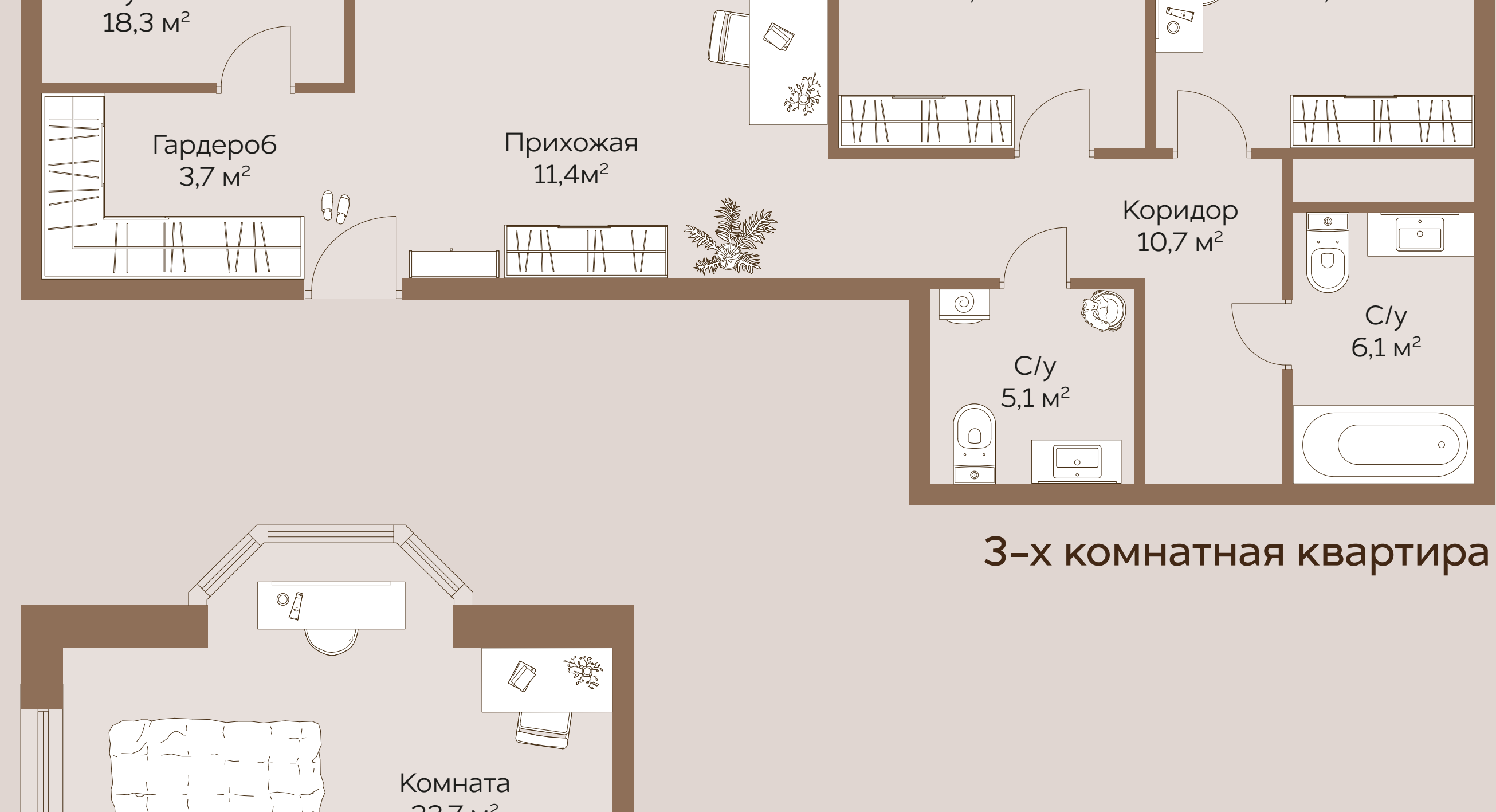
3-х комнатная квартира

Квартирография ЖК «Кватро» предусматривает планировки с наличием нескольких санузлов, организованных гардеробных комнат, а также с панорамным остеклением эркеров.