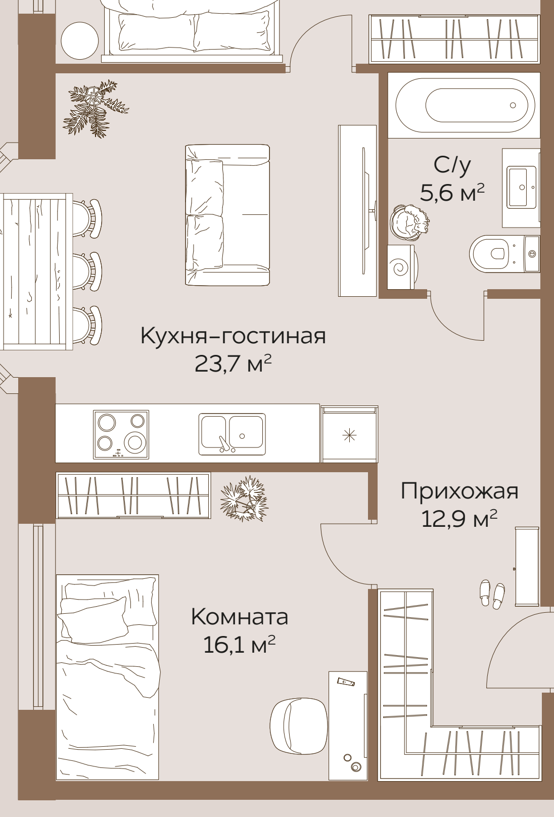
2-х комнатная квартира