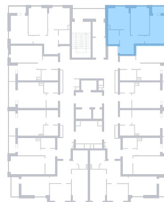
ул. Печерская На плане