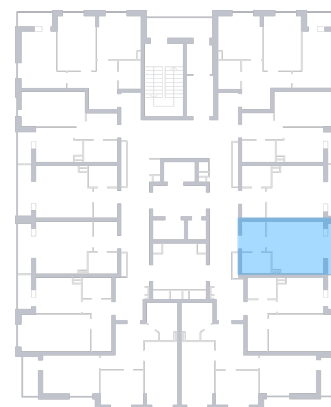
ул. Печорская На плане