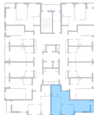
ул. Печерская На плане