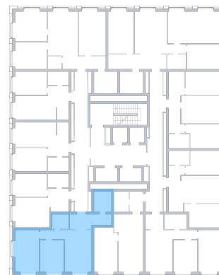
ул. Московское шоссе На плане