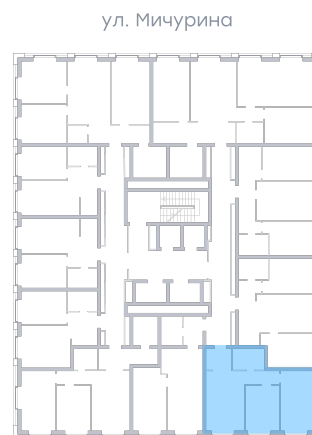
ул. Мичурина ул. Московское шоссе На плане