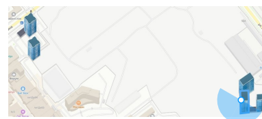
Вид из окна