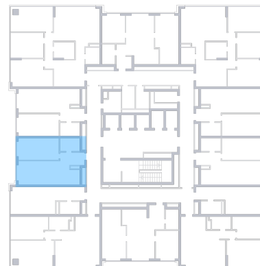
ул. Московское шоссе На плане