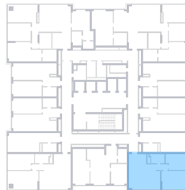
ул. Московское шоссе На плане