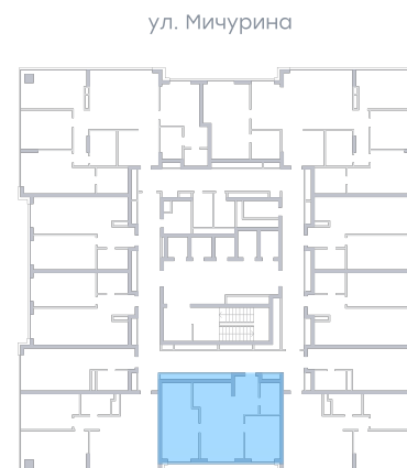
ул. Московское шоссе На плане