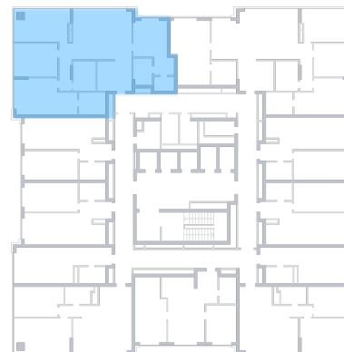
ул. Московское шоссе На плане