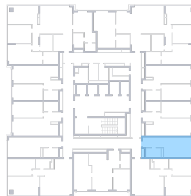
ул. Московское шоссе На плане