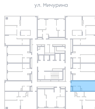
ул. Московское шоссе На плане