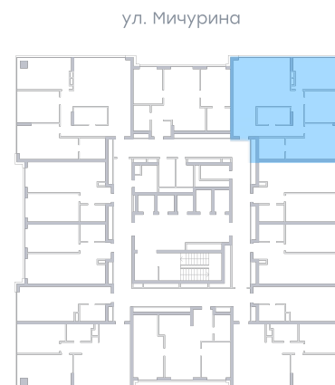
ул. Московское шоссе На плане