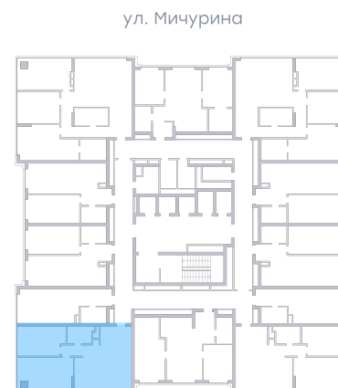
ул. Московское шоссе На плане