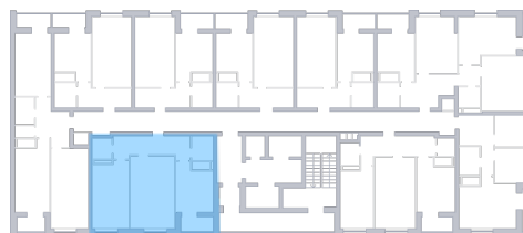
Вид во двор На плане