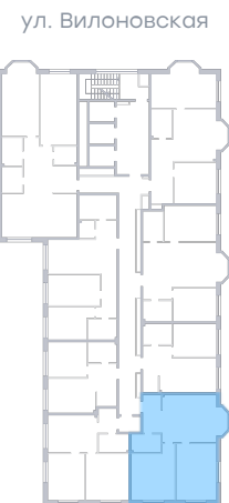
ул. Рабочая На плане