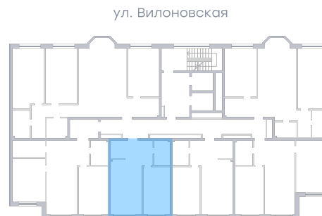
ул. Рабочая На плане