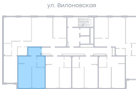
ул. Рабочая На плане