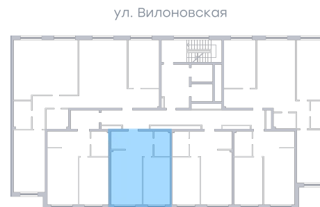
ул. Рабочая На плане