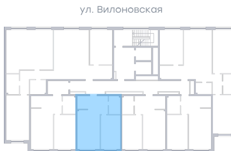
ул. Рабочая На плане