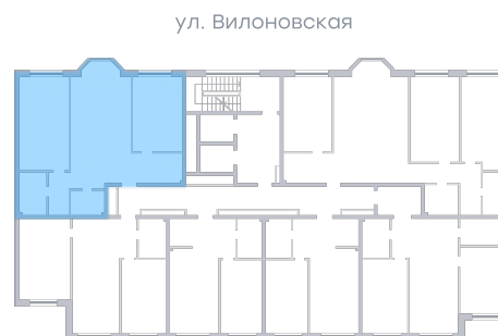
ул. Рабочая На плане