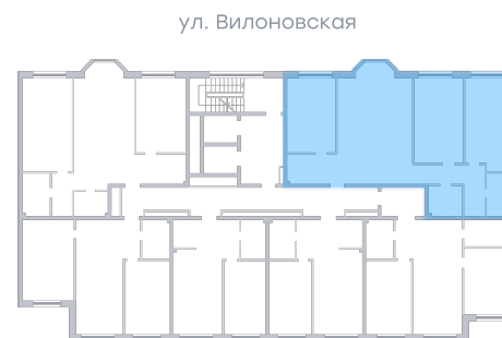
ул. Рабочая На плане