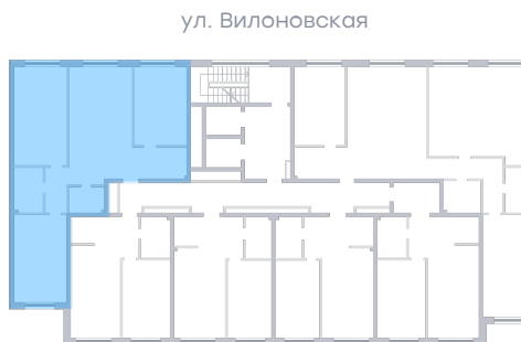
ул. Рабочая На плане