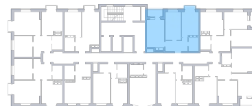
ул. 22 Партсъезда На плане