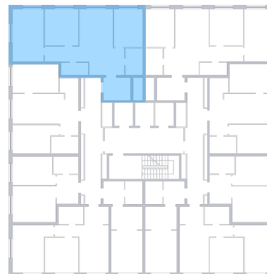
ул. Губанова На плане