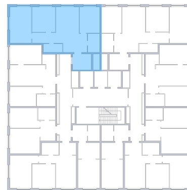
ул. Губанова На плане