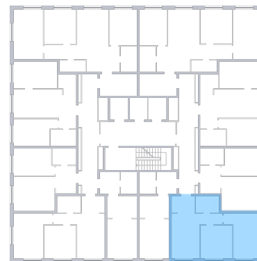
ул. Губанова На плане