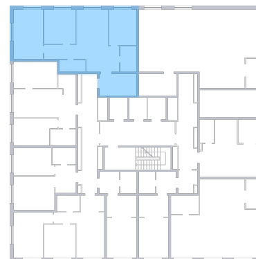
ул. Губанова На плане