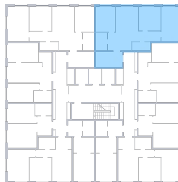
ул. Губанова На плане