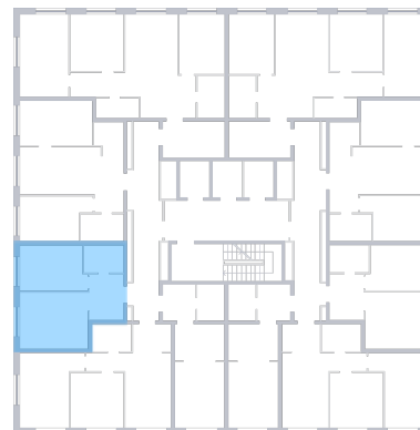
ул. Губанова На плане