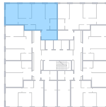
ул. Губанова На плане